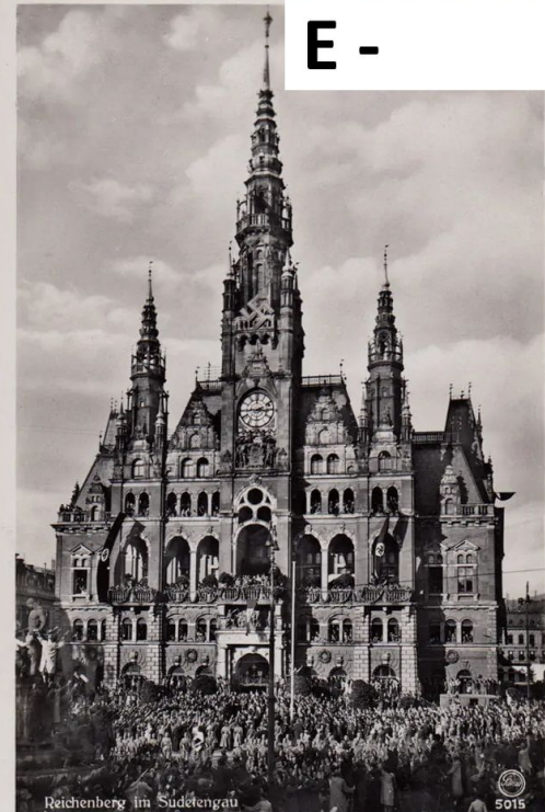
Reichenberg im Sudetengau