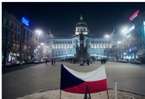
Václavské náměstí v Praze, 1. 1. 1993