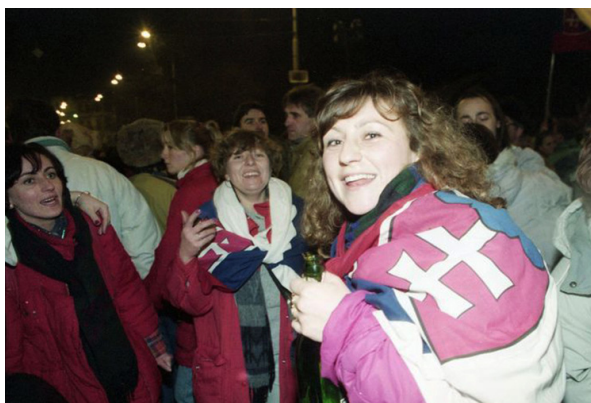
Náměstí SNP v Bratislavě, 1. 1. 1993

Československo zaniklo 1. 1. 1993 a vznikly dva nové státy – Česká republika a Slovenská republika. Následující fotografie zachycují situaci v pražských a bratislavských ulicích. Co nám tato dvojice fotek říká o zániku starého státu a vzniku těch nových?