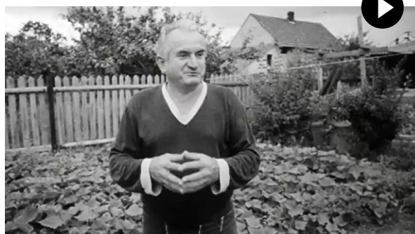
Zdroj: Diktatura svědomí , režie: Vítězslav Bojanovský (1987)

Úryvek z dobového televizního dokumentu o jedné dělnické rodině. Zatímco otec se považuje za přesvědčeného komunistu, syn vstup do KSČ odmítá.