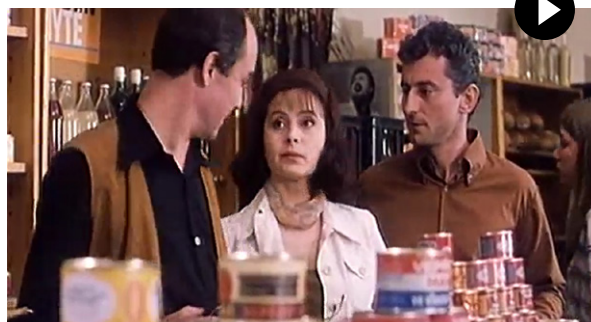
Zdroj: Báječná léta pod psa , režie: Petr Nikolaev (1997)

Hraný film zachycuje osudy rodiny Vítkových. Z obavy před postihem za to, že se otec angažoval v pražském jaru, odešli Vítkovi z Prahy do městečka Sázava. I když se snaží na sebe neupozorňovat, čas od času jsou vystaveni určitým problémům.