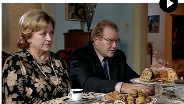
Zdroj: Zdivočelá země III , režie: Hynek Bočan (2007)

Scéna je zasazena do podzimu 1969. Otec s matkou přijeli na návštěvu za synem a jeho manželkou. Scéna je z televizního seriálu a je to fikce, ale odpovídá situacím, které tehdy lidé zažívali.