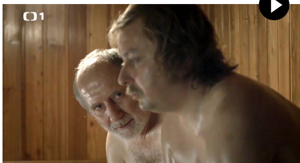
Zdroj: České století – Je to jen rock'n'roll (1976), režie: Robert Sedláček (2013)

Rozhovor Václava Havla s anonymním přítelem je zasazen do podzimu 1976, do doby, kdy Václav Havel uvažoval o tom, že vystoupí proti komunistickému režimu. Za pár měsíců poté vznikla Charta 77. Scéna je z hraného televizního seriálu, ale zachycuje situace, které tehdy lidé skutečně prožívali.