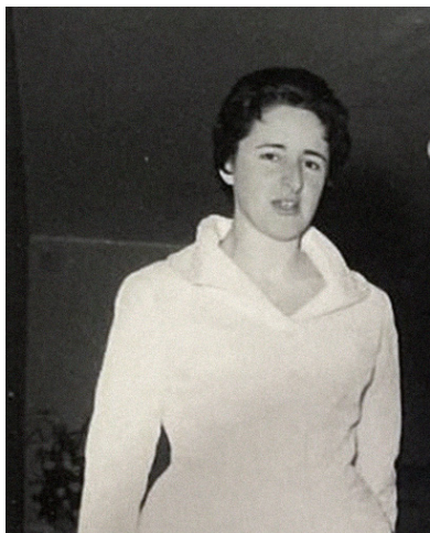
Zdroj: Trudy Bandler Scaramuzzi (2022)