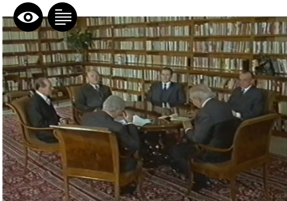
Zdroj: Gottwald (1986), režie: Evžen Sokolovský

Popište vlastními slovy celkový dojem z obou ukázek.