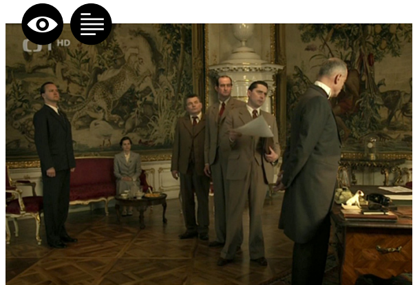
Zdroj: České století (2013), režie: Robert Sedláček