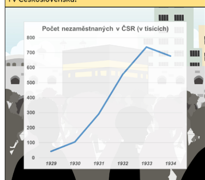
Počty nezaměstnaných v době krize výrazně rostly i v Československu.