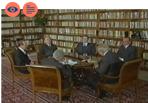
Videoukázka 1 z roku 1986

Popište vlastními slovy celkový dojem z obou ukázek.